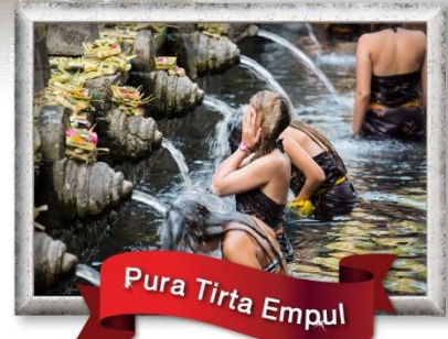
Pura Tirta Empul