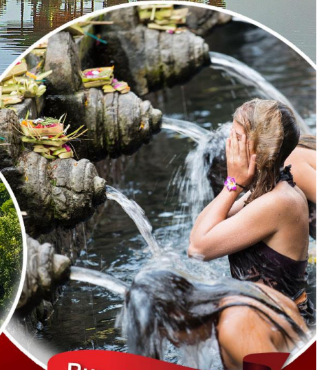
Pura Tirta Empul

มนต์เสน่ห์ เกาะบาหลี วิหารทานาห์ลอต บ่อน้ำพุศักดิ์สิทธิ์ Pura Tirta Empul หมู่บ้านคินตามณี ภูเขาไฟ, ทะเลสาบ บาดูร์